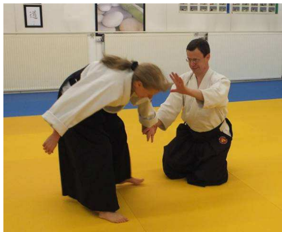
Kaiten-nage aus Hanmi-hantachi