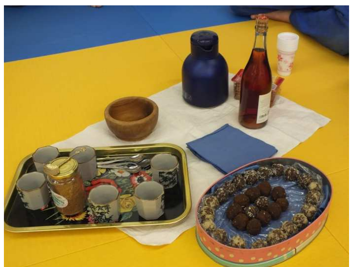
selbst gemachte Leckereien zur Stärkung