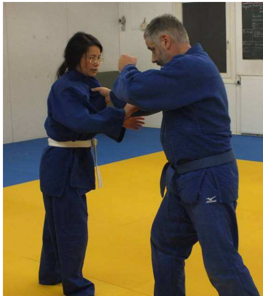
Keine Angst vor starken Männern ...